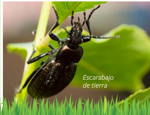
Escarabajo de tierra

La mayoría de los insectos son beneficiosos; solo un 1 a 5 % de los insectos que hay en nuestros jardines o huertos son plagas. Los insectos útiles, como los escarabajos de tierra, las catarinas y las crisopas, ayudan a controlar las plagas. No rocíe productos a la primera señal de daño; la naturaleza podría controlar las cosas por usted. Además, las plantas suelen sobreponerse a los daños.