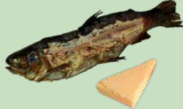
肉類、魚類及奶製品