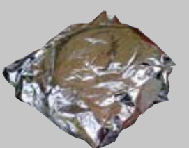
沾有食物的錫箔紙