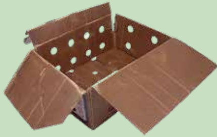
沾有油漬的披薩紙盒及帶蠟質塗層的紙箱