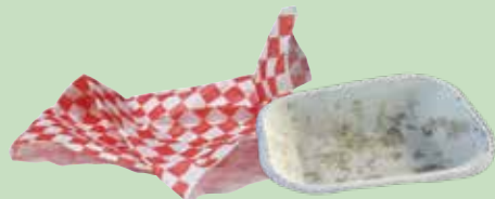
無塑膠塗層紙盤及餐巾紙