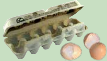
蛋殼、堅果殼及包裝紙盒