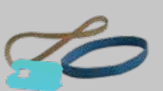
橡皮筋及包裝繫帶