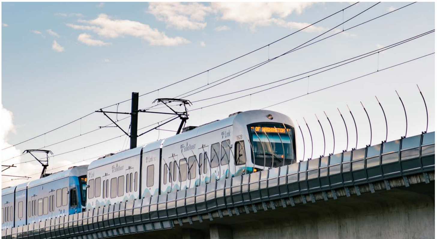
輕軌即將開通至 NE 130th 和 I-5 公路

工程聯絡人： Drue Nyenhuis NE130thSt_NE125thSt_Project@seattle.gov (206) 400-7515 www.seattle.gov/transportation/NE130thMobilityProject