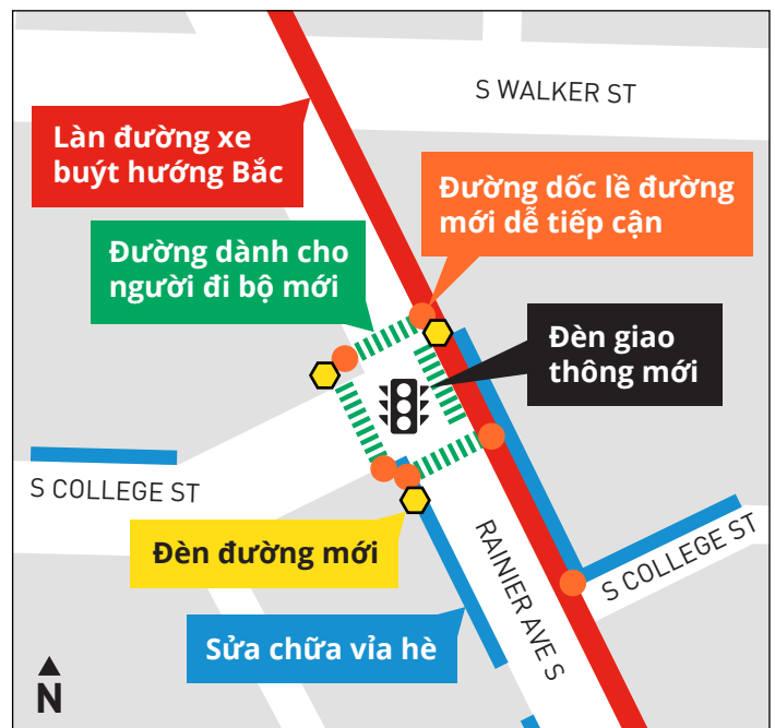
Cải thiện an toàn tại giao lộ đường Rainier Ave S và S College St.

Quý vị có câu hỏi? Quý vị muốn nhận thông tin cập nhật về dự án không?