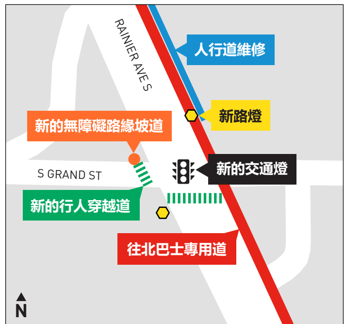
Rainier Ave S 與 S Grand St 交叉路口的安全改善。

這個工程之所以能夠實現，要感謝西雅圖的選民在 2020 年 11 月通過了《西雅圖交通法案》(提案 1)，這項法案為我們城市更頻繁、更可靠、更便利的公車服務提供了資金來源。