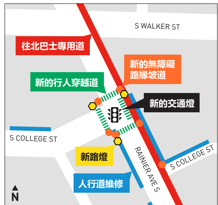
Rainier Ave S 與 S College St 交叉路口的安全改善。