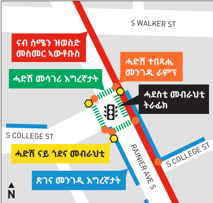
ኣብ መስቀለዊ መጋጠሚ Rainier Ave S ን S College St ውሑስነት ዘረጋግጹ ምምሕያሻት።