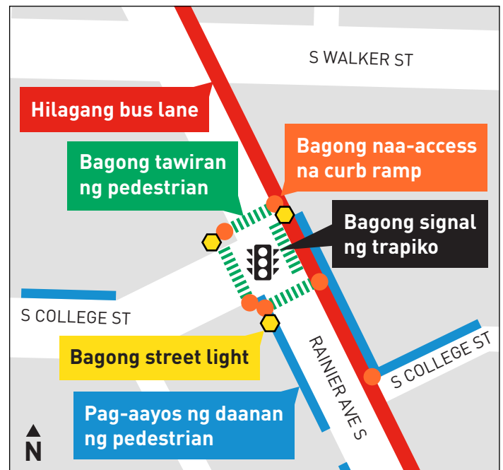
Mga pagpapabuti sa kaligtasan sa interseksyon ng Rainier Ave S at S College St.

Mayroong bang mga katanungan? Interesadong makatanggap ng bagong mga balita sa proyekto?