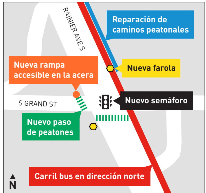
Mejoras de seguridad en la intersección de Rainier Ave S y S Grand St.

Este proyecto es posible gracias a que los votantes de Seattle aprobaron la Medida de Transporte Público de Seattle (Proposición 1) en noviembre de 2020, que creó una fuente de ingresos para un servicio de autobuses más frecuente, confiable y accesible en nuestra ciudad.