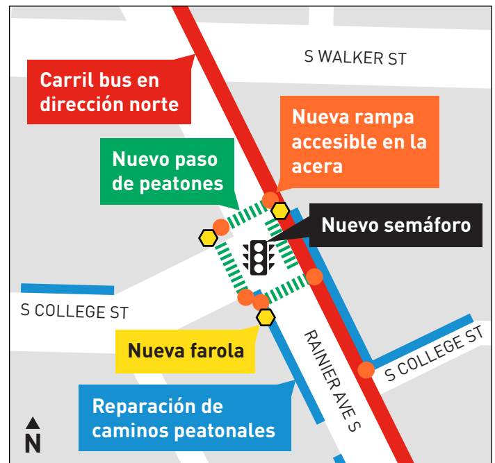
Mejoras de seguridad en la intersección de Rainier Ave S y S College St.