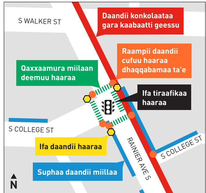
Fooyya'iinsa nageenyaa qaxxaamura Rainier Ave S fi S College St irratti.