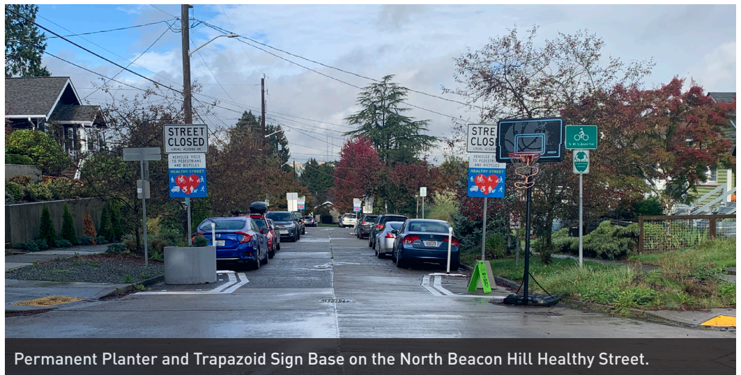
Permanent Planter and Trapezoid Sign Base on the North Beacon Hill Healthy Street.