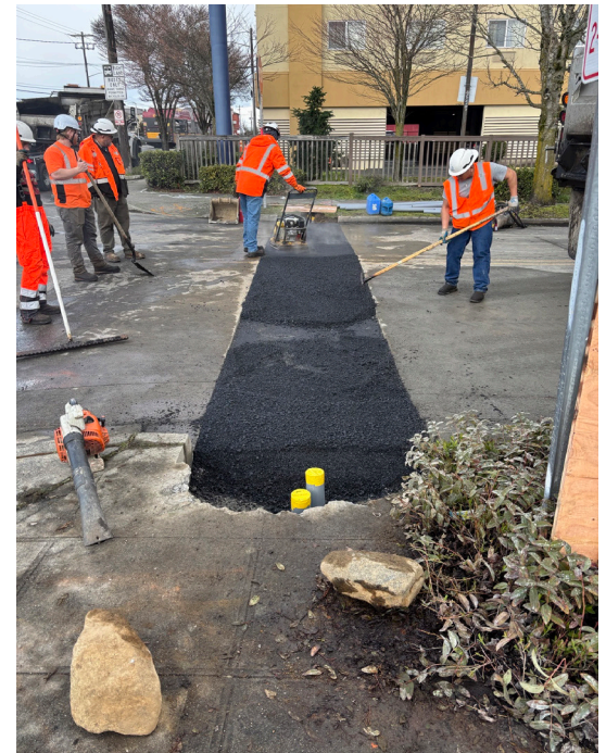
施工人员在 Aurora Ave N 和 N 137th St 铺设沥青，为新建的人行横道和交通信号灯做准备