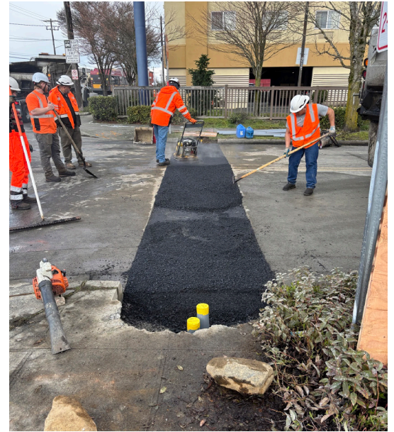
Các đội thi công trải nhựa đường trên Aurora Ave N và N 137th St để chuẩn bị cho các lối băng qua đường và tín hiệu giao thông mới