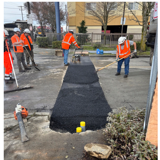
Ang mga trabahador ay naglalagay ng aspalto sa Aurora Ave N at N 137th St upang maghanda para sa mga bagong tawiran at mga signal sa pagtawid