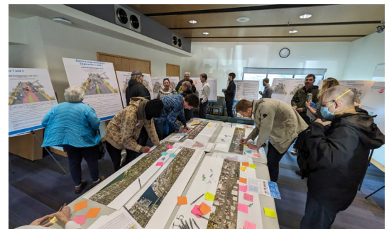
2024년 Aurora Ave N 디자인 콘셉트에 대해 피드백을 공유하는 지역 사회 구성원들