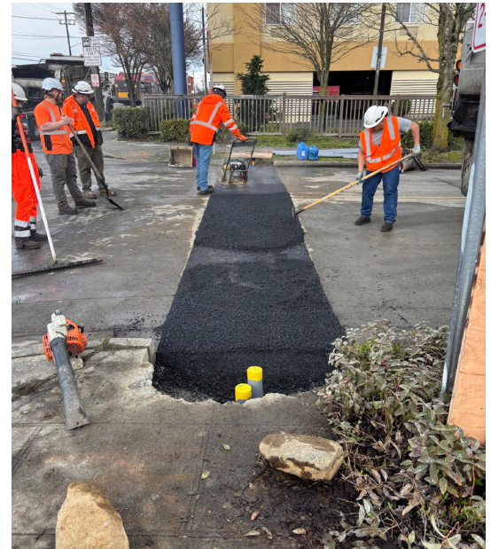
Trabajadores colocan asfalto en Aurora Ave N y N 137th St para preparar los nuevos cruces peatonales y las señales de cruce