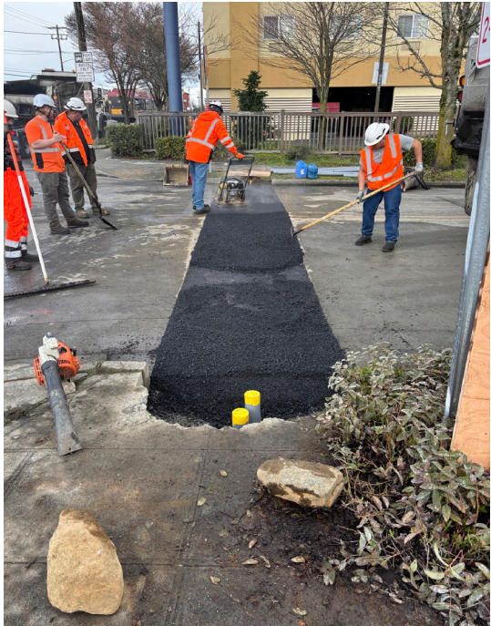
የሰራተኛ ቡድኖች ለአዳዲስ የእግረኛ መሻገሪያዎች እና የመሻገሪያ ምልክቶች ለመዘጋጀት በAurora Ave N እና N 137th St ላይ አስፋልት እያነጠፉ