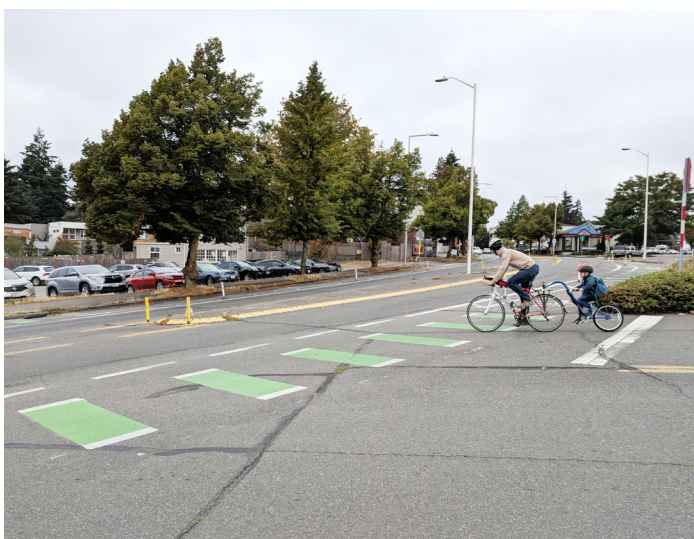
Visibilidad existente, canalización y desafíos del cruce: hacia el norte en Pinehurst Way NE y NE 117th St

Para servicios de traducción e interpretación, llame al (206) 316-2549