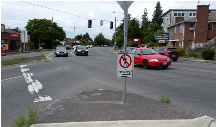
ንኣሸተይ ናይ ኣግሪኛ “ደሴት” ኣብ ማእኸኡ 15 Ave S ን S ኮሎምቢያን ወይ ፤ጥቕ ብቅኤጡኡ ዝንቀሳቀሱ ተሸክርኦርቲ ይቕመጥ።