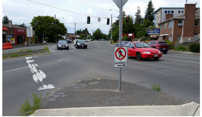
在15th Ave S和S Columbian Way中间, 离快速行驶的车辆很近的地方有一个很小的人行“岛”。