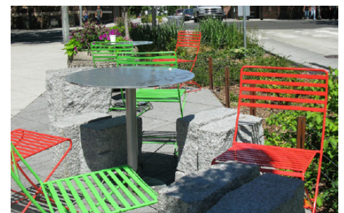
在市中心 Bell St 上的公共空间范例