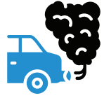
환경적 영향 및 오염

각 지역마다 고유의 우려 사항과 문제들이 있었습니다. 모든 지역들에서 교통 체증 완화 솔루션, 프로젝트 및 개입을 확대할 필요가 있습니다. 각 지역사회는 우회 도로의 영향에 대처하기 위한 추가적인 아이디어와 창의적 솔루션을 제시했습니다.