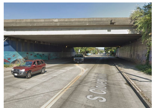
Các nhóm nhân công sẽ thay thế bóng đèn dưới cầu vượt State Route 99 trên South Cloverdale Street.