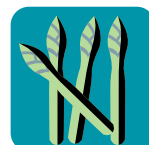
Espárragos (antes de guardarlos corta media pulgada de profundidad cubriendo de manera suelta con una bolsa)

Guarda en el paquete original o empaque hermético