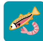
Pescado y camarones (frescos)

Enjuaga y escurre, luego guarda en un empaque hermético en una capa de hielo