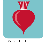
Betabeles o remolacha