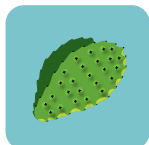
Nopales o cactus