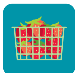
Frutos rojos y moras

Guarda en bolsas con perforaciones o contenedores