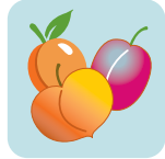
Frutas con hueso o carozo (maduras) duraznos, nectarinas, ciruelas, chabacanos