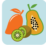
Frutas tropicales (maduras) kiwis, mangos, papayas