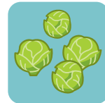
Coles de Bruselas