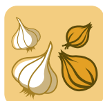
Ajo y cebollas

Guarda en bolsas con perforaciones o contenedores