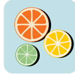
Cítricos naranjas, limas, limones, toronja