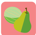
Frutas que necesitan madurar (melones, peras, frutas tropicales y con hueso, aguacates)