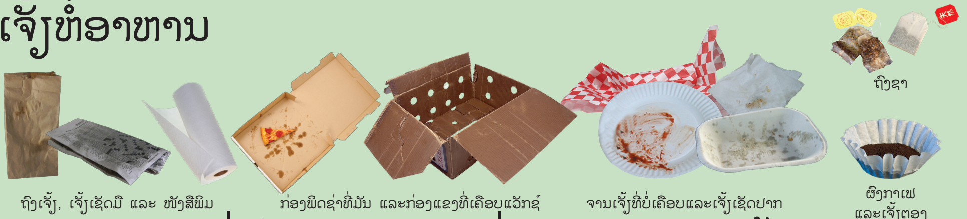
ຖົງເຈັ້ງ, ເຈັ້ງເຊັດມື ແລະ ຫັງສີພິມ