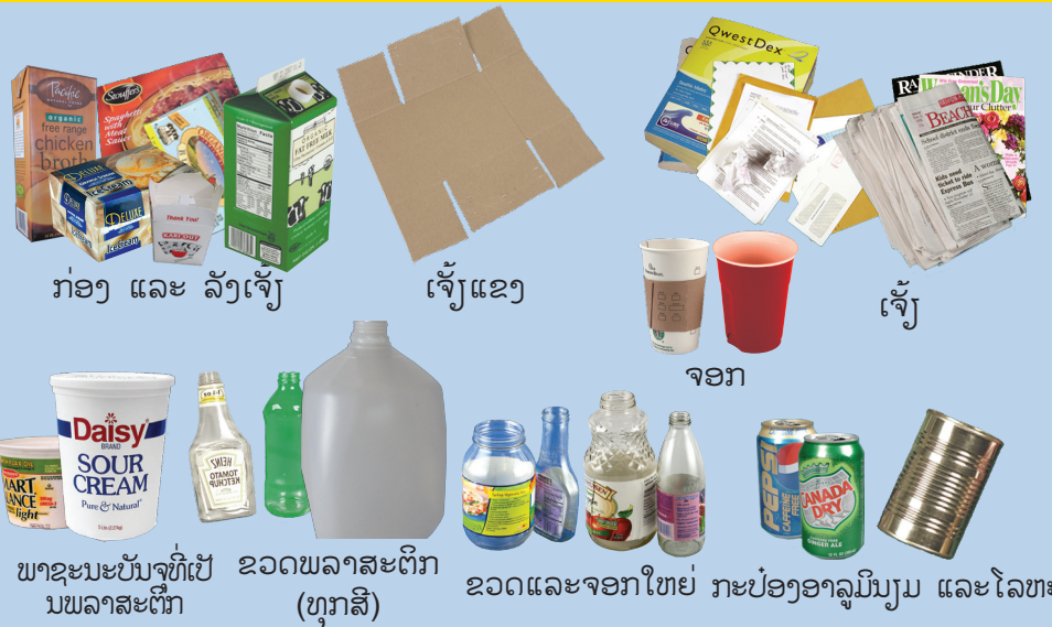
ກ່ອງ ແລະ ລັງເຈັ້ງ