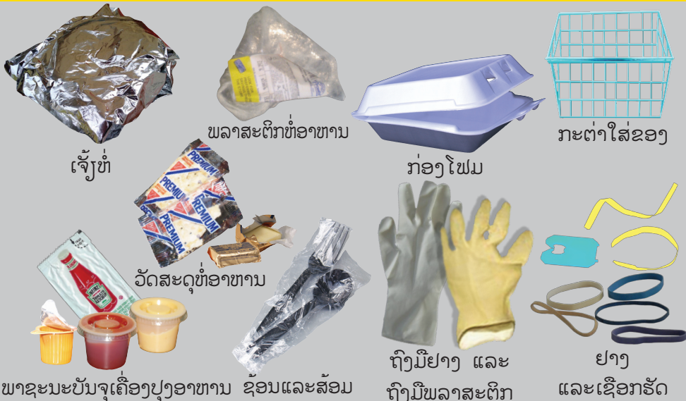
ເຈັ້ງທໍ່

ຖິ້ມຂີ້ເຫຍື້ອເຫຼົ່ານີ້ລົງໃນຖັງຂີ້ເຫຍື້ອຊະນິດທີ່ນຳກັບມາໃຊ້ຄືນໃໝ່ໄດ້