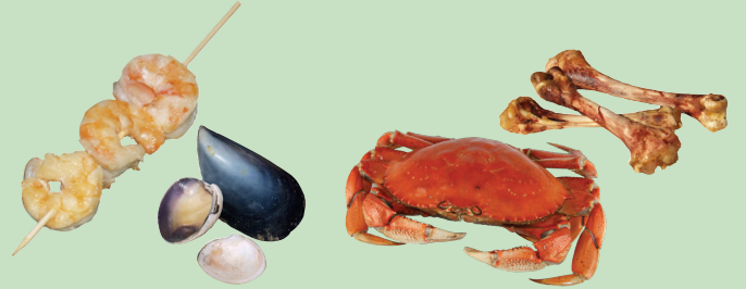
조개 껍데기와 뼈