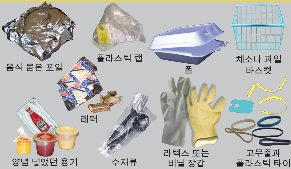
음식 묻은 포일