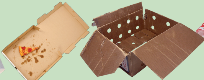
기름 묻은 피자 상자와 왁스 처리된 카드보드