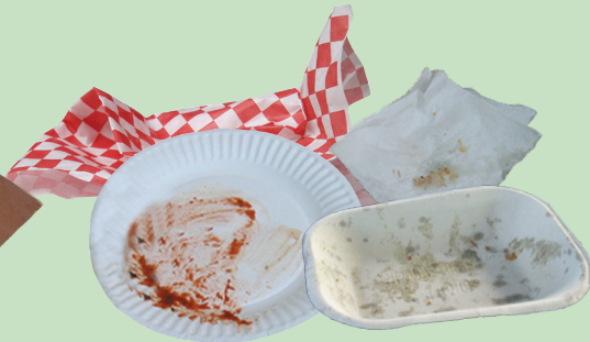
코팅 안된 종이 접시와 냅킨