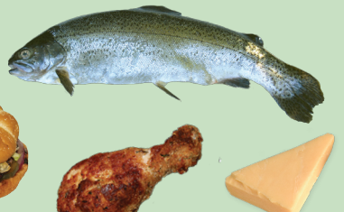
고기, 생선, 유제품