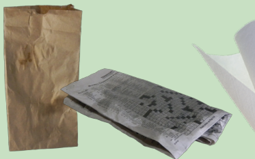
종이 백, 수건, 신문지