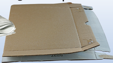
ក្រដាសកាតុង