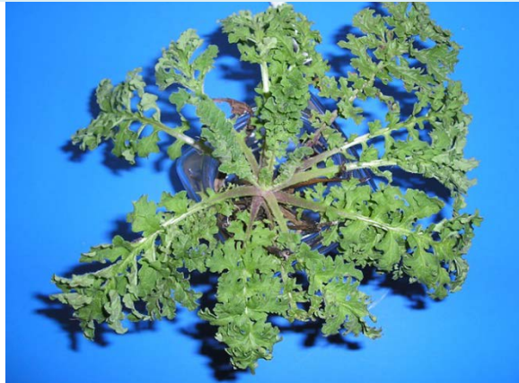
Planta joven: roseta basal de hojas onduladas