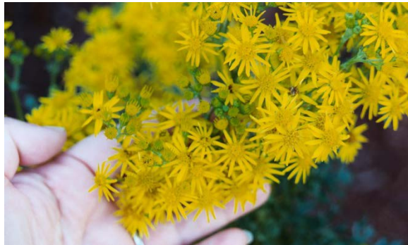
Flores son parecidas a las margaritas con pétalos amarillos y la parte central también es amarilla