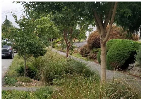
ዝተወደኣ ኣብነት ተፈጥሮአዊ ስርዓት መወገዲ ፈሳሲ ኣብ ጎደና መንበሪ ኣባይቲ።