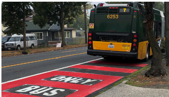
ኣብነት ናይ ቀይሕ ኣውቶቡስ ጥራሕ መገዲ

እቶም ናይ ኣውቶቡስ ጥራሕ መገዲ ዝኸኑ ናብ ኣደ ኣንፈት ጥራሕ መጎዓዚያ እዮም እዚ ድማ ን Rainier Ave S ከም ኣካል Rainier Ave S Vision Zero project ን መሰመር መጎዓዚያ 7 Transit-Plus Multimodal Corridor (TPMC) ፕሮጀክትን ናይ ውሑስነትን ናይ ምንቅስቓስ ክእለትን ምምሓያሻት ብምህናጽ ብዝብለጸ ሞሉእ ዝኸን ጎደና ንምግባር ኣብ ምሰራሕ ንርከብ።