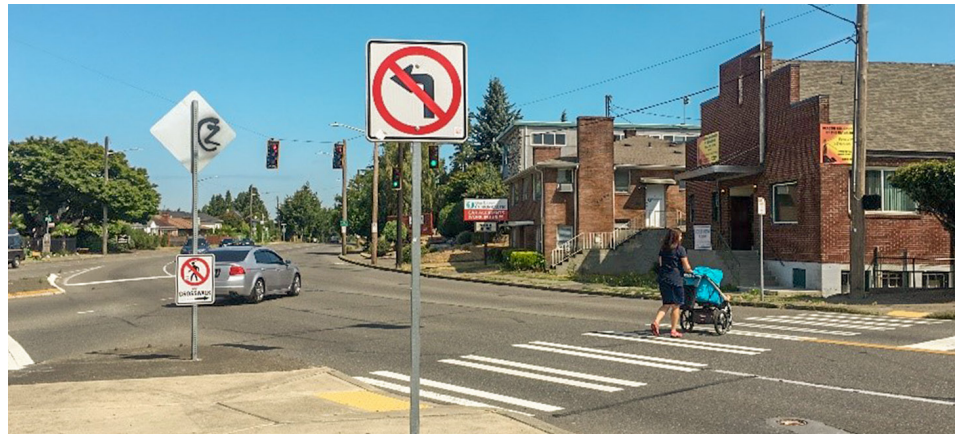
Safety improvements will be made at the intersection of 15th Ave S, S Columbian Way, and S Oregon St.

15th Ave S between S Spokane St and S Angeline St provides an important connection for people traveling in and through Beacon Hill. SDOT is making improvements in this corridor that balance the needs of all users so that everyone can get where they need to go safely and conveniently.