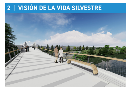
La visión de la vida silvestre ofrece a los usuarios del puente un punto de descanso y una vista del lago y los pantanos.