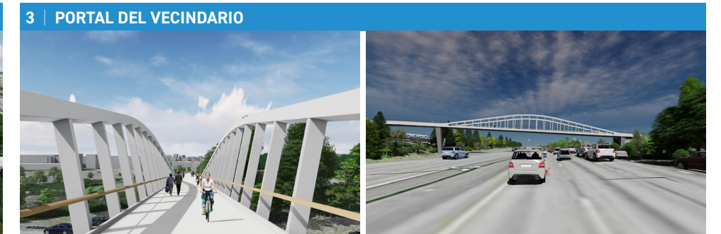
Las líneas de barrido del puente, en su cruce sobre la I-5 hacia el sur, crean un memorable punto de paso entre las comunidades.