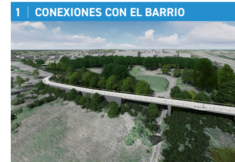
La conexión directa a nivel permite amplias vistas sobre el puente