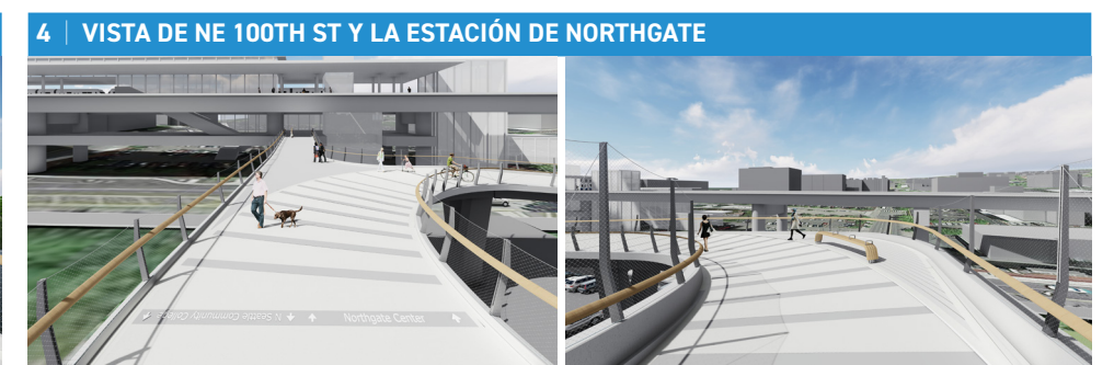
Desde el abordaje en pendiente del este, la vista de NE 100th St permite observar los trenes que llegan y salen de la estación de ferrocarril ligero.