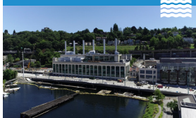
Lander St Bridge